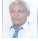
—नाति महर्जन ध:चपा, पांगा

न्हयन्दाँ दुम्ह जि छम्ह बुराचा बुराचा धासां आ:तकला सुडाचा ग्वाय् दाहिं ला हाकुसे च्वनि अयसां हे धाई जित पुलां मनूचा